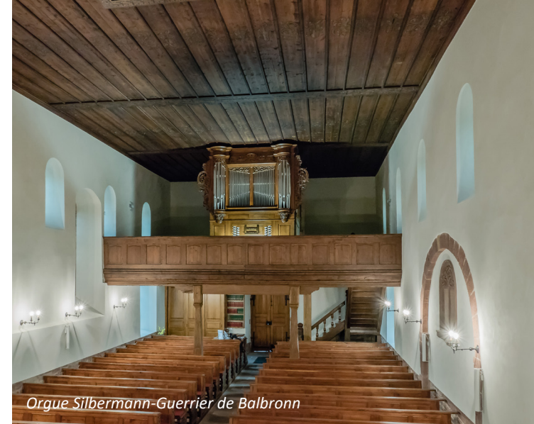
Orgue Silbermann-Guerrier de Balbronn

Au programme figurent les concertos HWV 289 et 296a de G.F. Haendel, la sonate BWV 1031 pour flûte et clavier obligé de J.S. Bach ainsi que le concerto op. 26 n°4 de M. Corrette.