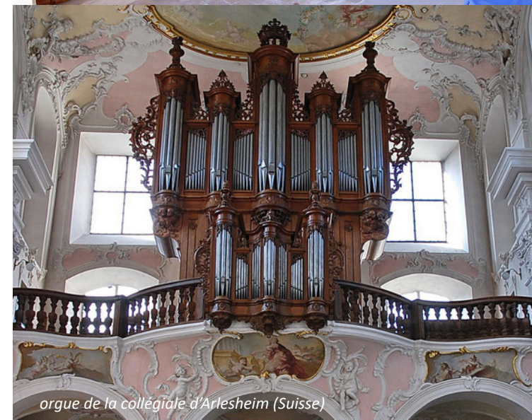
orgue de la collégiale d'Arlesheim (Suisse)

Renseignements et inscriptions : 06 81 19 84 72 (date limite d'inscription : 30 avril 2025)