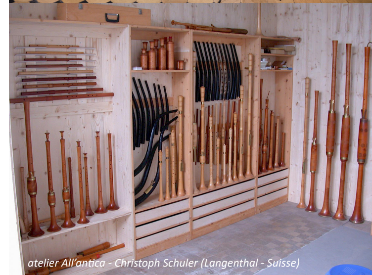
atelier All'antica - Christoph Schuler (Langenthal - Suisse)